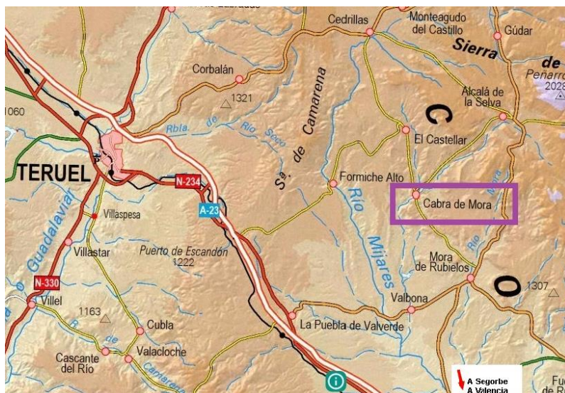
SITUACIÓN DE LA LOCALIDAD DE CABRA

Desde la A23 a través de Mora de Rubielos se llega a Cabra de Mora, si vienes de Valencia desde la salida que hay para Mora de Rubielos, si vienes de Teruel se coge el desvío en la Puebla de Valverde.